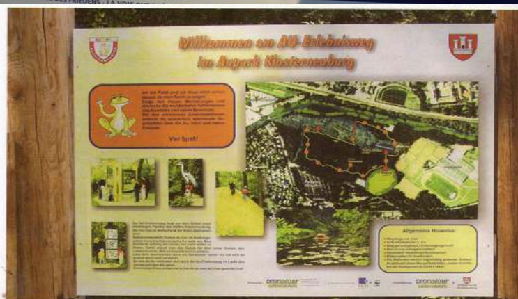
Foto 7.6: Eine gut gestaltete und informative Eingangstafel wie am Au-Erlebnisweg in Klosterneuburg (Niederösterreich) ist für jeden Lehrpfad ein Muss!