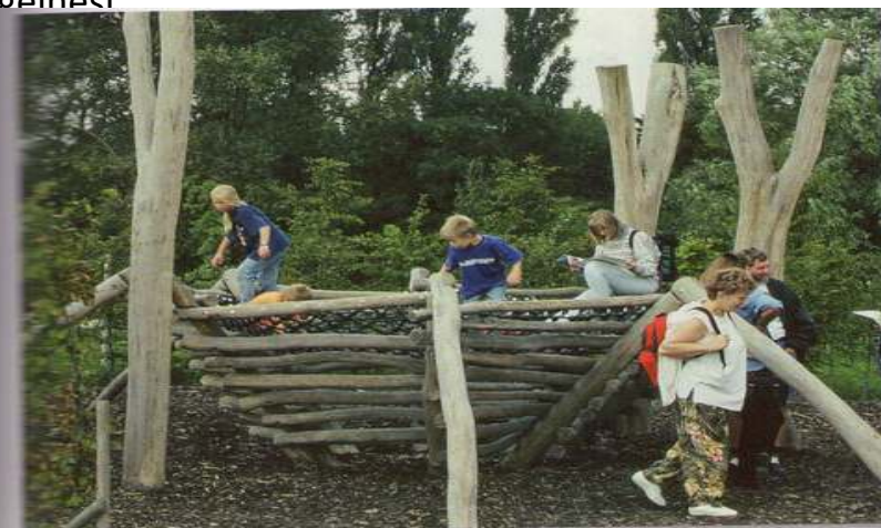
Abb. 12: Das bekletterbare Vogelnest ermöglicht Naturerfahrungen in „Vogelgröße“.